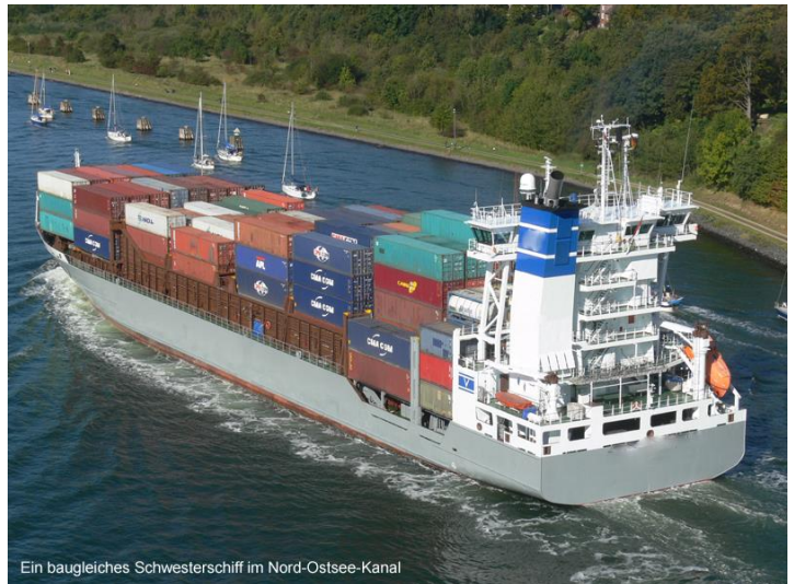
Ein baugleiches Schwesterschiff im Nord-Ostsee-Kanal

Containerschiff, Flagge Antigua, Nationalität des Kapitäns: deutsch/international, Nationalität der Reederei deutsch,