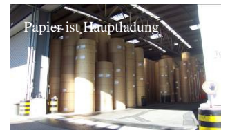
Papier ist Hauptladung