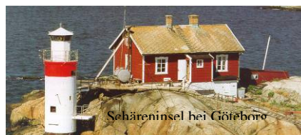
Schäreninsel bei Göteborg