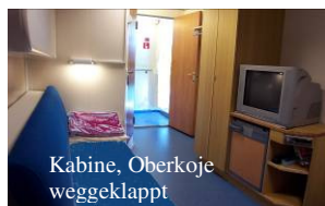
Kabine, Oberkoje weggeklappt