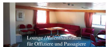
Lounge /Aufenthaltsraum für Offiziere und Passagiere

Zusätzlich zum Kabinenpreis sind pro Person und Reise zu addieren: